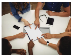
La structure sollicitée pour recevoir, conseiller le conjoint(e)